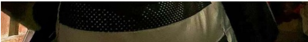
Eine Überlebende wurde gefunden.

Am Dienstag sei eine Frau unter den Trümmern gefunden worden. Sie hatte sich durch Klopfzeichen bemerkbar gemacht. Nach mehrstündiger Arbeit unter dem Einsatz schwerer Gerätschaften wie Bohrhammer oder Kernbohrer konnte die Frau lebend geborgen werden. So beschreibt es ein Bericht des Bundesverbands Rettungshunde (BRH), der mit dem Team vor Ort in Kontakt steht. Einer der guten Momente, die die Helfer im Katastrophengebiet in der Türkei erleben. Die Zahl der Opfer des schweren Erdbebens an der Grenze zwischen der Türkei und Syrien ist auf bislang 11.000 gestiegen.